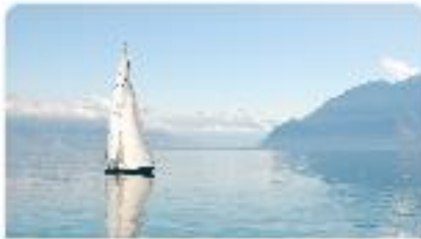
Servizi fiscali per me

SERVIZI ALLA FAMIGLIA: in questa sezione ( se prevista dalla convenzione aziendale ) trovi i servizi di patronato che puoi acquistare tramite il portale EasyLife