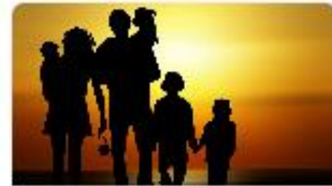
Servizi alla famiglia