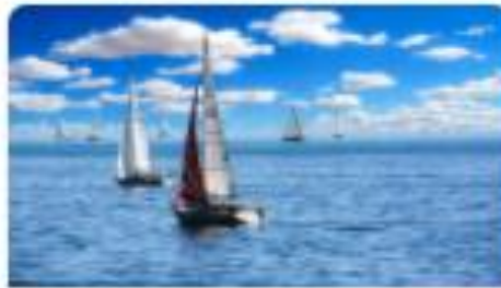
Servizi fiscali per parenti e amici